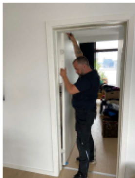
2. Dørbladet løftes væk