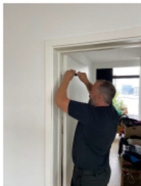
1. Dørens hængsler afmonteres